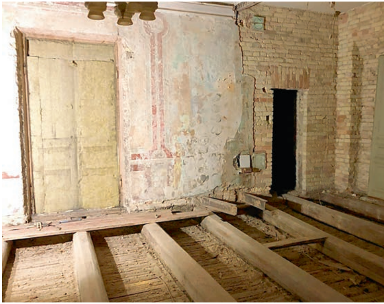
Ardant sienas paaiškėjo, kad po dažais slypi kur kas daugiau – atsivėrė freskos.

„Tas mūras buvo padarytas labai nevėkšliškai – numušus tinką jis tiesiog nugriuvo, ir atrado-