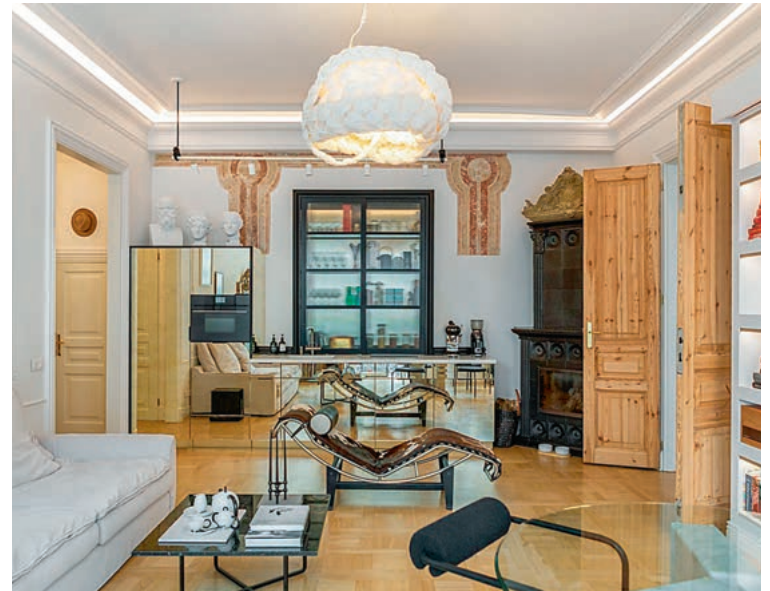
Interjeras nėra užbaigtas – jis nuolat keičiasi ir auga kartu su šeiminkais.

me senas duris“, – pasakojo moteris. Durys buvo restauruotos ir sugrąžintos į buto interjerą – dabar jos veda į miegamąjį.